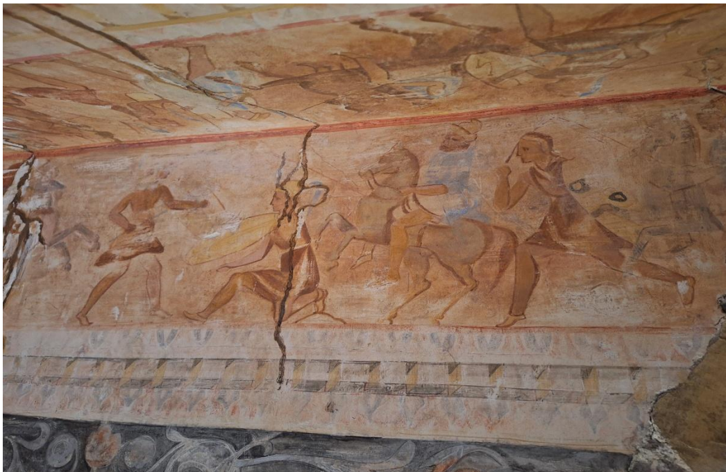
Thrakische Fresken in einem Grabmal