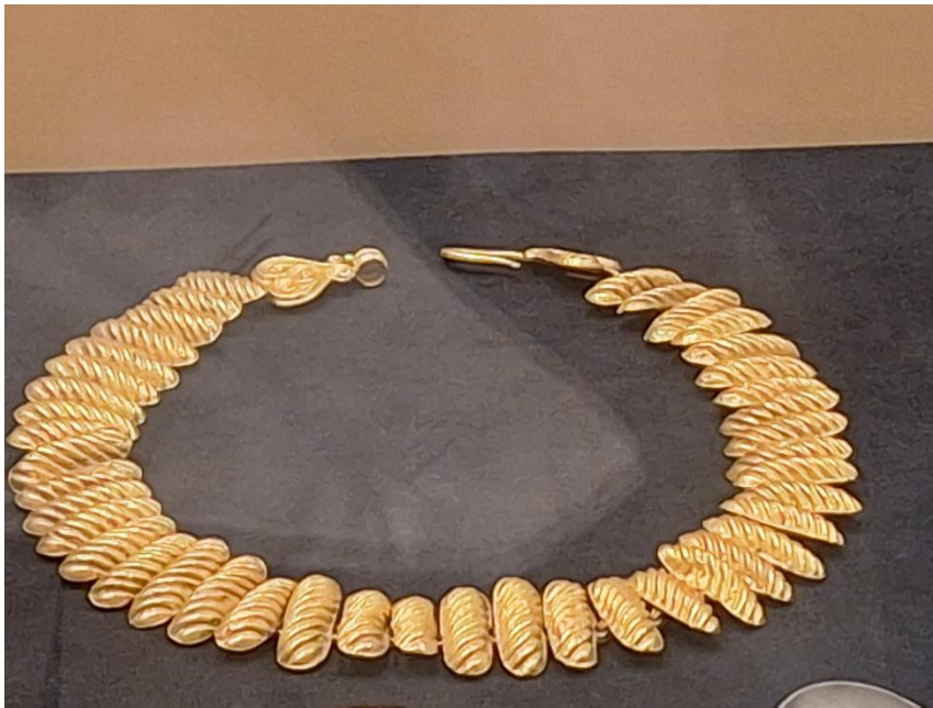
Aus dem Goldschatz der Thraker--Grabbeigaben